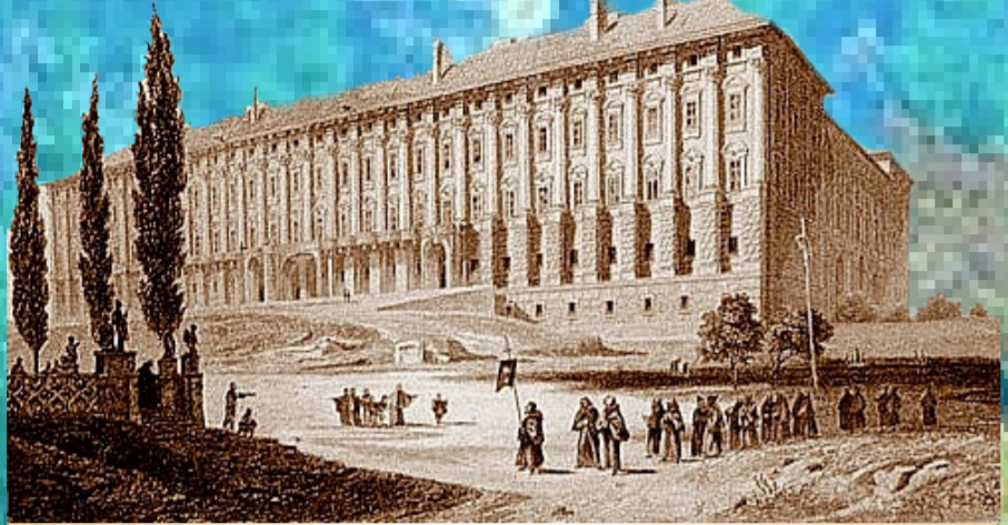
Otec Heřmana Jakuba Czernina (*1659 † 1710) Humprecht Jan Czernin (*1628 † 1682) byl od roku 1667 stavebníkem pražského Černínského paláce na Hradčanech, dnešního sídla ministerstva zahraničních věcí.