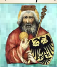
Mistr Theodorik: sv. Karel Veliký