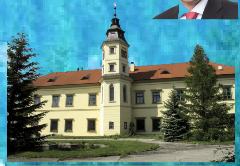
Czerninský rodový zámek Dymokury dnes a dříve